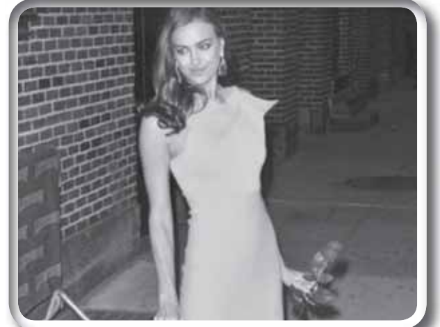
صديقة رونالدو والوردة الحمراء

كما عمل مورينيو مترجماً في نادي برشلونة الإسباني ضمن الكادر الفني للمدرب لويس فان غال، قبل أن يتحول إلى المهنة التدريبية الكاملة.