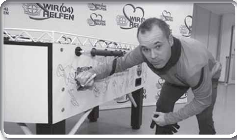
انيستا يوقع على البيبي فوت