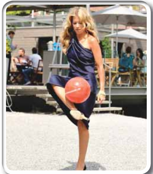
سيلفي فان در فارت

أكدت عارضة الأزياء الأميركية كيللي بيسوتي أنها من عشاق النادي الملكي ريال مدريد وأنها ستقيم حفلاً لعرض أزياء الملابس الداخلية في مدريد إذا أحرز الملوك لقب الليغا، وأكدت أنها ستحاول التأثير على رونالدو لثنيه عن عدم الرحيل عن ريال مدريد وأنها تتوقع أن يصل المدير إلى نصف نهائي دوري الأبطال.