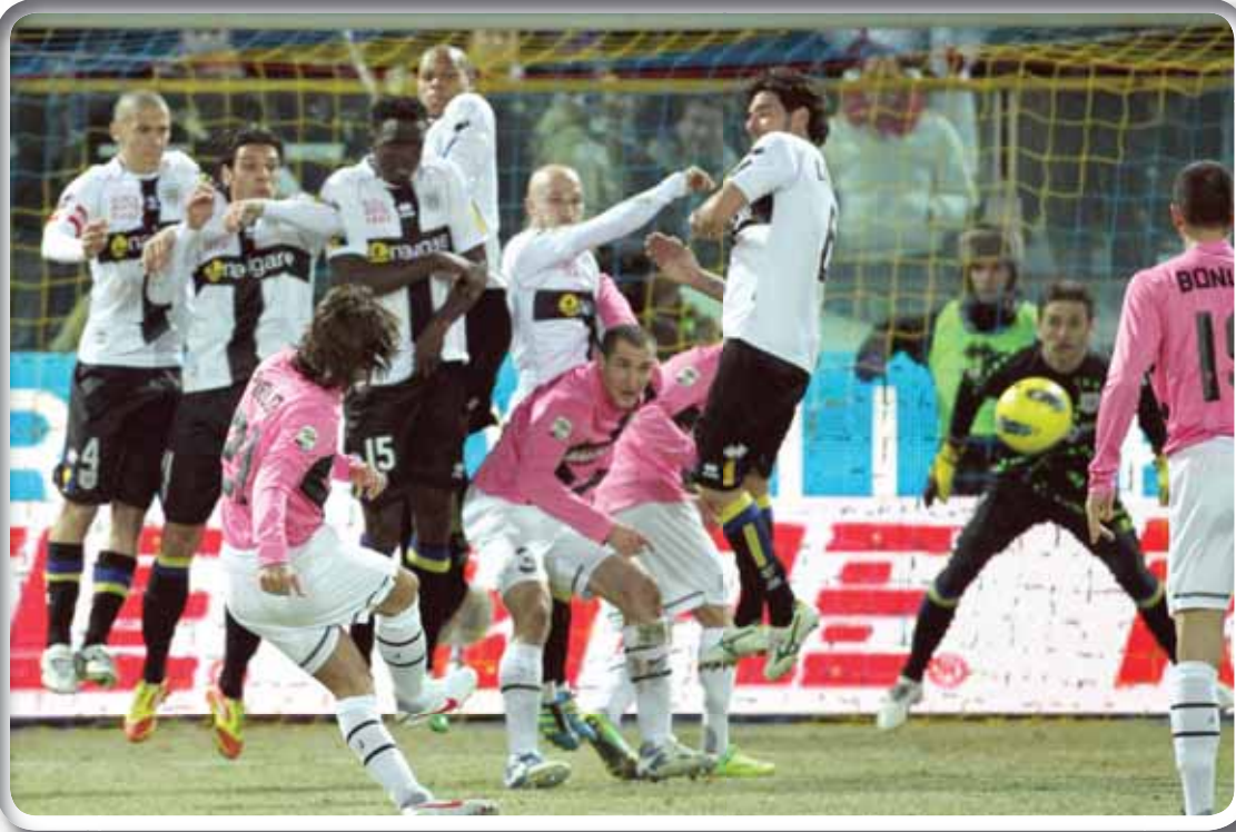
لقطة من مباراة يوفنتوس وبارما