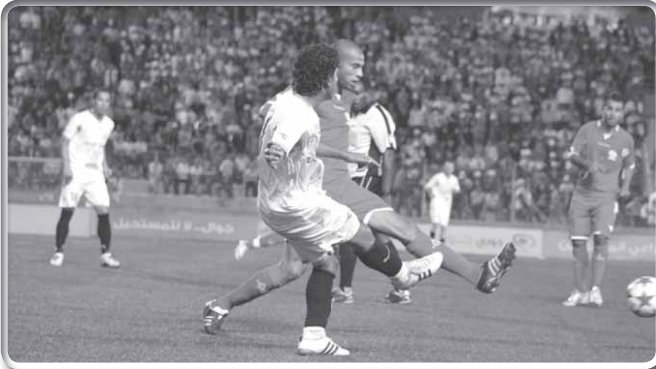
لقطة من مباراة الدوري الاول

رام الله - محمد سدر - تتسلط الاضواء غدا في الجولة الخامسة عشرة من دوري جوال للمحترفين على مباراة المتصدر «الهلال» ووصيفه شباب الخليل اللذين يلتقيان على استاد الحسين بن علي. تكمن أهمية المباراة لأنها قد تحدد هوية البطل في حال فوز الهلال، وبهذه الحالة يرتفع رصيد الهلال الى 39 نقطة ويضمن المركز الاول حتى في حال خسارته للمباريات الثلاث المتبقية! الشباب ليس امامه سوى الفوز ليرفع رصيده الى 32 نقطة ويقلل الفارق مع الهلال لأربع نقاط على أمل تعثر الهلال في المباريات المقبلة وهو امر وارد جدا كون الهلال يلاقي مؤسسة البيرة التي تصارع من أجل الهبوط والظاهرة العنيد والامعري بطل الدوري الماضي.