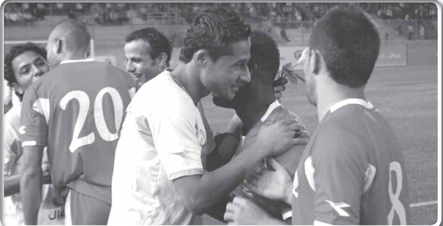
عناق بين لاعبي الفريقين في مباراتهم بالدوري الاول

تحرص «الحياة الرياضية» دوماً على تقريب وجهات النظر، وترفض الانجرار وراء مهاترات إعلامية تزيد من الاحتقان الرياضي الفلسطيني، وهو ما يدفعنا إلى المطالبة بضرورة رفع درجات التوعية للجماهير المحلية من خلال عقد ورش عمل داخل مقرات الأندية للتأكيد على أساليب التشجيع الحضاري ونبذ الشغب الجماهيري والعمل سوية على النهوض بالرياضة الفلسطينية وقيادتها إلى مزيد من التطور. وعليه توجه «الحياة الرياضية» رسالة إلى مسؤولي الفريقين وروابط مشجعي الأندية، للعمل على الخروج باللقاء بصورة تليق بالرياضة الفلسطينية وشعب الجبارين، بما يضمن ألا تصبح «بورسعيد» مذبحة فلسطينية في المستقبل.