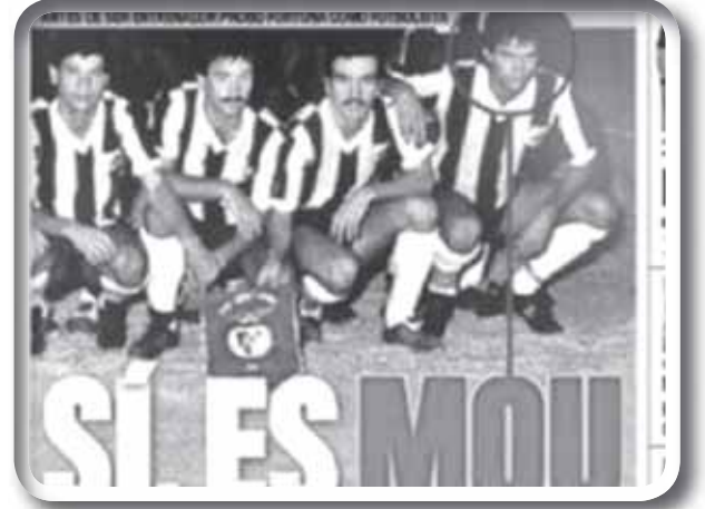
مورينيو (أقصى اليمين)

بدأ المدير الفني لفريق مانشستر سيتي التفكير جدياً بالتعاقد مع لاعب ريال مدريد دي ماريا مستغلاً تدمير اللاعب من تدني الراتب الذي يحصل عليه في الفريق الملكي. ويتقاضى اللاعب الأرجنتيني الشاب صاحب الـ24 عاماً 80 ألف جنيه استرليني أسبوعياً، وهو مبلغ لا يرضي اللاعب في ظل الأرقام الكبيرة التي يحصل عليها زملاؤه في الفريق. وذكرت صحيفة «ديلي ستار» الإنجليزية أن مانشستر سيتي ينوي إغراء اللاعب براتب كبير للانتقال إلى ملعب الاتحاد في الصيف المقبل، ليعزز به صفوف الفريق.