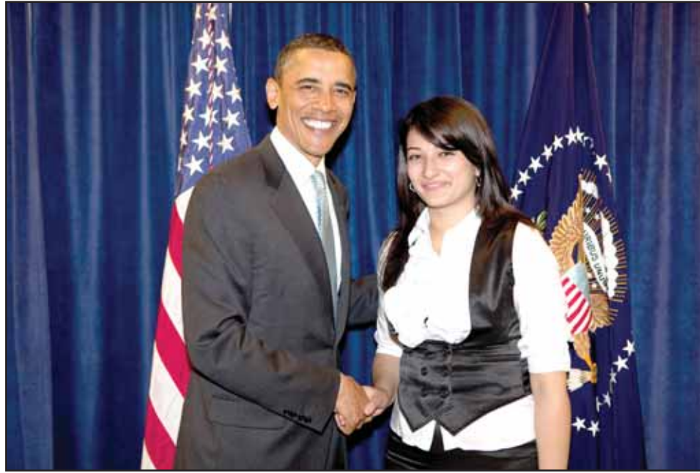
الطويل على هامش قمة الرياديين الاقتصاديين مع الرئيس اوباما

ورغم ما حققته وهي في مقتبل العمر تقول وعد بلغة المديرة الصارمة وبصراحة الطفلة الحقيقية: "لم اتوقع ان اصادف هذا النجاح في هذا العمر قبل التجربة والانخراط فيها، تبدو الأمور صعبة وتحقيقها بعيد المنال.. الصعوبات والعراقيل دائما موجودة ولكن العمل على حلها بروية وعناد ينبغي ان يبقى قائما. لا وصفة لدي او نصيحة أقدمها لتحقيق النجاح والمضي على الدرب الصحيح سوى التحدي الايجابي، ما دمنا سلبيين واستسلاميين ستصعدنا الصعوبات وتظهر لنا في كل لحظة ومع كل خطوة. لكن التحفز والتحدى المستند الى التجربة والتحسب للمفاجآت غير المتوقعة في عالم الأعمال يقود الأمور للنجاح" وهو لوعده الشابة الطموحة الراضية عن مسيرتها رديف لمصطلح العمل.