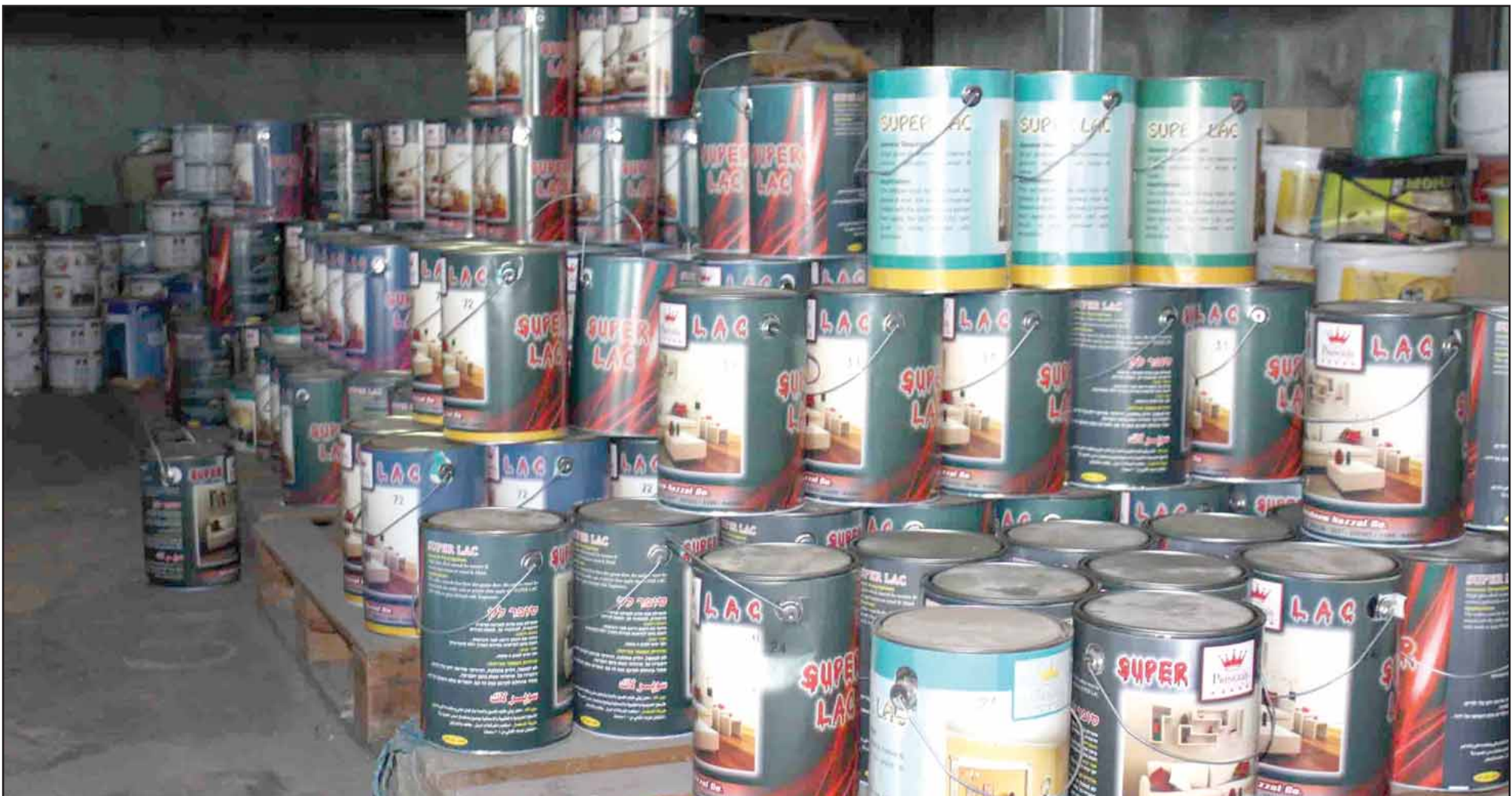
منتجات الشركة التي يملكها نزال