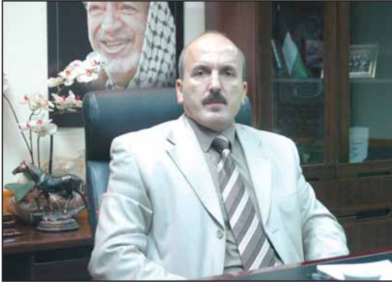
محافظ طولكرم اللواء طلال دويكات

شعب منتج وقادر على بناء اقتصاده ودولته على أسس وثوابت سليمة». وحول العقبات التي تواجه الاستثمار في مدينة طولكرم أوضح دويكات ان أهم عقبة هي عدم توفر اراض كافية للمشاريع الإنتاجية والإجراءات الإسرائيلية التي تعرقل إقامة المشاريع الاستثمارية على الاراضي المصنفة ضمن منطقة (C) وهي تشكل الغالبية الساحقة من الأراضي التي يمكن تنفيذ المشاريع عليها، وإحجام بعض المستثمرين عن المبادرة في تنفيذ مشاريع ضخمة بحجة عدم استقرار الوضع السياسي، مؤكدا ان السلطة تحاول تذليل العقبات والإجراءات البيروقراطية المتعلقة بتنفيذ بعض المشاريع منوها الى انه تم خلال الفترة الماضية جمع أسماء وعناوين وأرقام هواتف كل أبناء المحافظة الكريمة الميسورين الذين يعيشون في الدول العربية وتقوم المحافظة بإجراء اتصالات هاتفية معهم وحثهم على تنفيذ مشاريع اقتصادية في المحافظة الكريمة بشكل خاص والوطن بشكل عام.