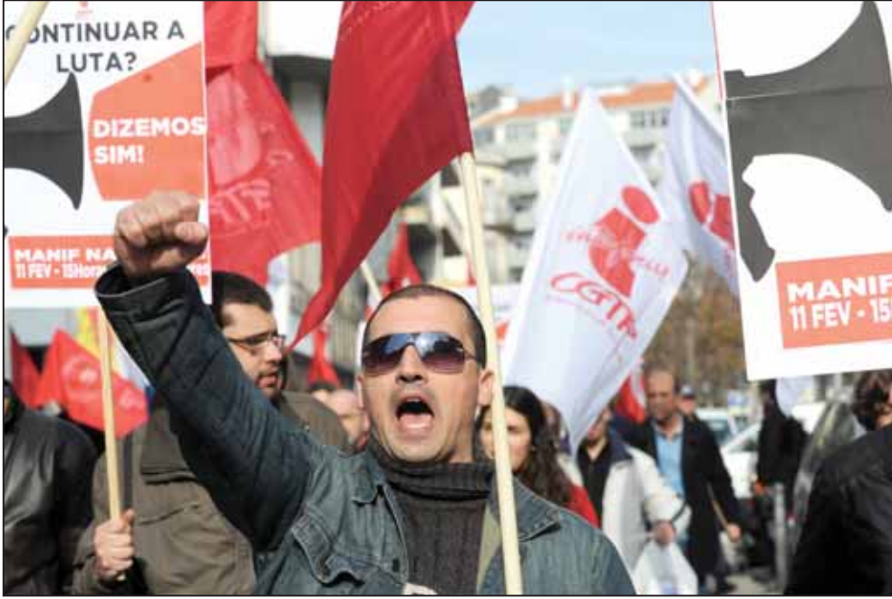
متظاهر برتغالي يهتف ضد التغييرات على قوانين العمل وذلك وسط العاصمة لشبونة.

الأوروبي يوم غد صفحة أزمة الديون وتتيح للحكومات التحرك باتجاه إقرار إجراءات لتنشيط النمو.