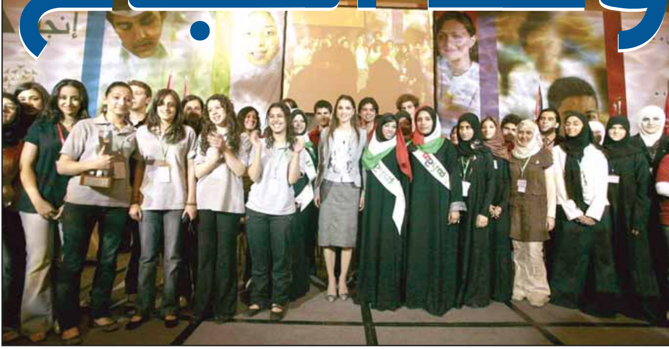
الملكة رانيا العبد الله مع الطلبة العرب الفائزين بمسابقة افضل شركة طلابية

الشركة الوليدة من مسعى لاغتنام فترة تكثر فيها الأعياد (الفرط والأضحى وعيد الفصح والميلاد ورأس السنة ويوم الشجرة وعيد الأم والحب .. الخ).