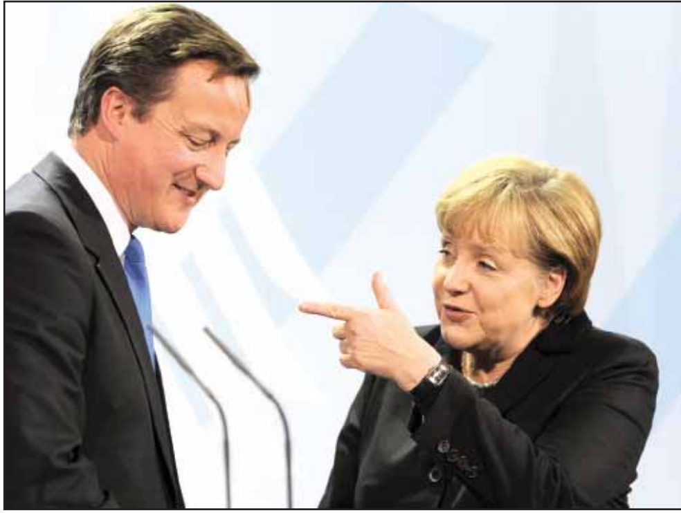
ميركل وكاميون.. وفاق لدود.

يذهب بعض الباحثين إلى أن العولمة ليست وليدة اليوم وليس لها علاقة بالماضي؛ بل هي عملية تاريخية قديمة مرت عبر الزمن بمراحل ترجع إلى بداية القرن الخامس عشر إلى زمن النهضة الأوروبية الحديثة حيث نشأت المجتمعات القومية. فبدأت العولمة ببزوغ ظاهرة الدولة القومية عندما حلت الدولة محل الإقطاعية، ما زاد في توسيع نطاق السوق ليشمل الأمة بأسرها بعد أن كان محدوداً بحدود المقاطعة. كذلك فإن العولمة انتشرت مع العصر الحديث وتكونت بما أحدثه العلم من تطور في مجال الاتصالات خصوصاً بعد بروز الإنترنت التي أتاحت مجالاً واسعاً في التبادل المعرفي والمالي، وارتباط نشأة الدولة القومية بالعولمة في العصر الحاضر فيه بعد عن مفهوم العولمة الذي يدعو أساساً إلى نهاية سيادة الدولة والقضاء على الحدود الجغرافية، وتعميم مفهوم النظام الرأسمالي واعتماد الديمقراطية كنظام سياسي عام للدول. ولكن هناك أحداث ظهرت ساعدت على بلورة مفهوم العولمة وتكوينه بهذه الصيغة العالمية فانهيار سور برلين، وسقوط الاشتراكية كقوة سياسية وأيديولوجية وتفرد القطب الأوح بالسيطرة والتقدم التكنولوجي وزيادة الإنتاج ليشمل الأسواق العالمية أدت إلى تكوين هذا المفهوم.