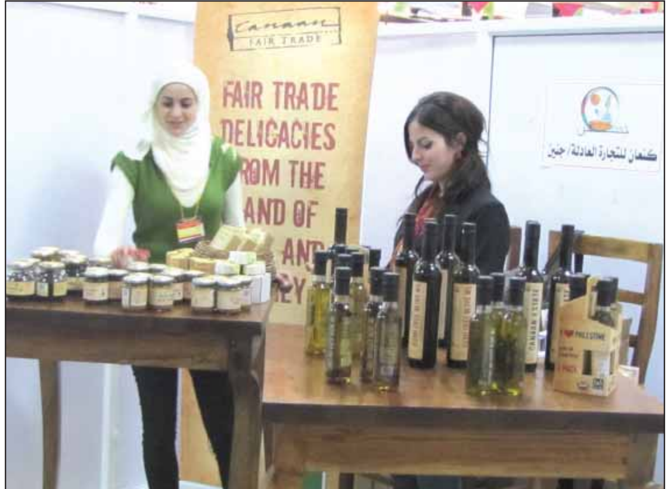
أحد اجنحة المعرض

وتتميز المعرض لهذا العام بمشاركة واضحة لقطاع الصناعات الزراعية،