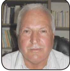
محمد علي طه

(د.ب.أ.) - أعلنت شركة مرسيدس أن سعر الموديل الأساسي من الفئة A الجديدة، المقرر طرحها نهاية الشهر الجاري، يبلغ 23 ألف و746 يورو. وأوضحت الشركة الألمانية أن الموديل الجديد من سيارتها الصغيرة يطل برتوش تصميمية جديدة، ونظام تعليق قابل للتعديل للنسخ القوية من السيارة، بالإضافة إلى تطوير الأنظمة المساعدة. وتضم باقة التجهيزات الاختيارية شاشة ملاحية كبيرة، وحلولا تقنية جديدة لدمج الهاتف الذكي، وكشافات عاملة بتقنية الدايودات المضئبة LED.