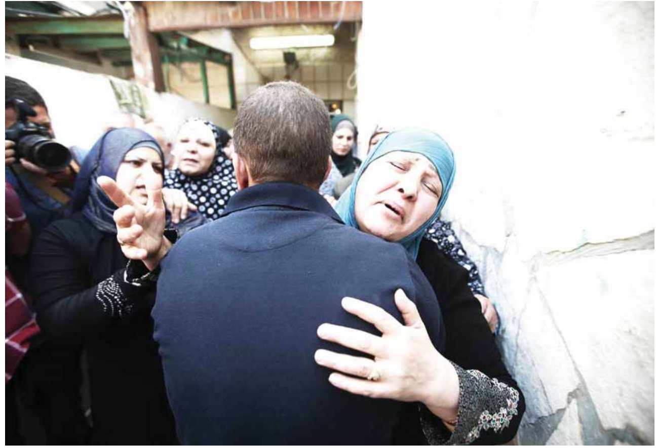
اقرباء الشهيد الكسبة يلقون الوداع عليه بعد استشهاده.