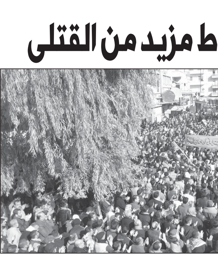
تظاهرة ضد النظام السوري في ادلب امس.