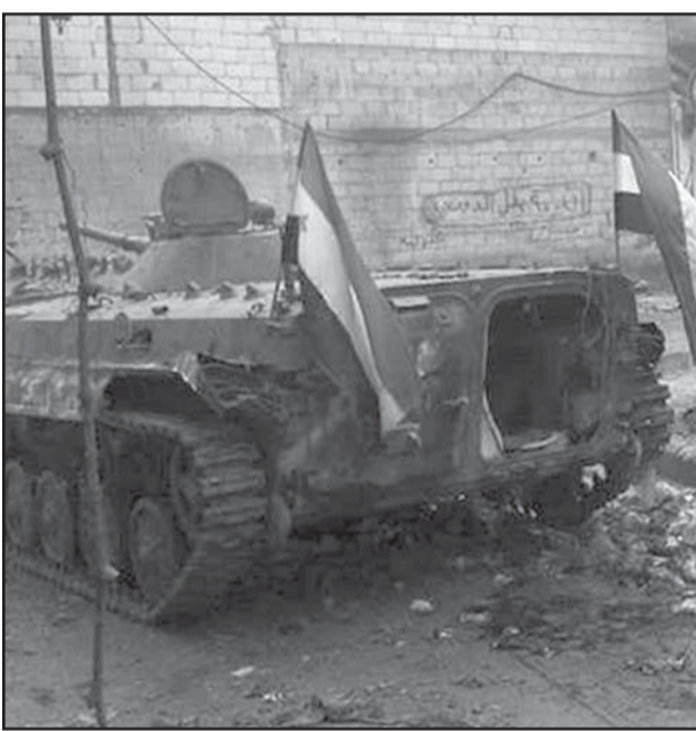
الجيش السوري الحر بدأ يصعد هجماته ضد قوات النظام رغم قلة امكاناته.