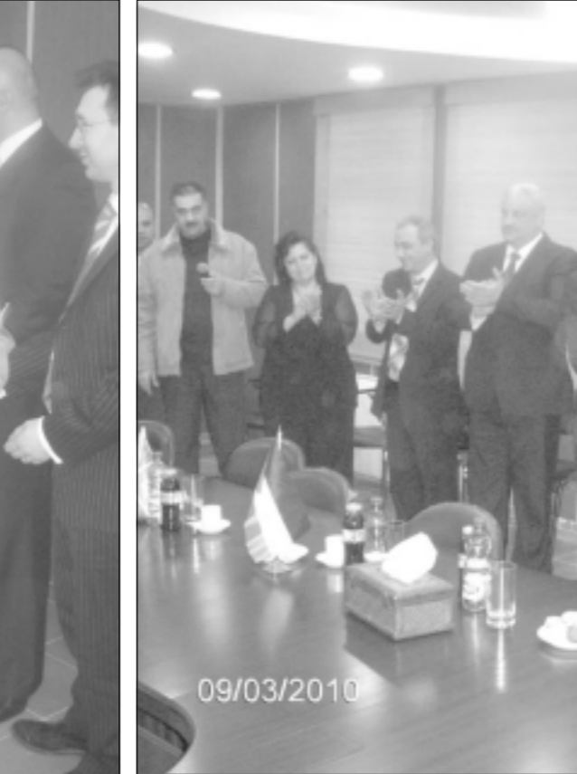
الضباط الخريجون يتسلمون الشهادات.

كما توجه وزير الداخلية إلى الملكة المتحدة شعبا وحكومة، بالشكر لاستمرار عملها في دعم قطاع الأمن ضمن كافة قطاعات السلطة الوطنية. وأكد وزير الداخلية في كلمته للخريجين أن العمل المتواصل لتطوير المؤسسة الأمنية يأتي في إطار التكامل بين قطاعي العدالة