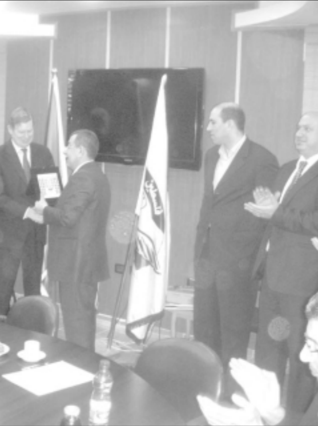
وزير الداخلية يسلم القنصل البريطاني درعاً تقديرا لعمله في دعم قطاع الامن.